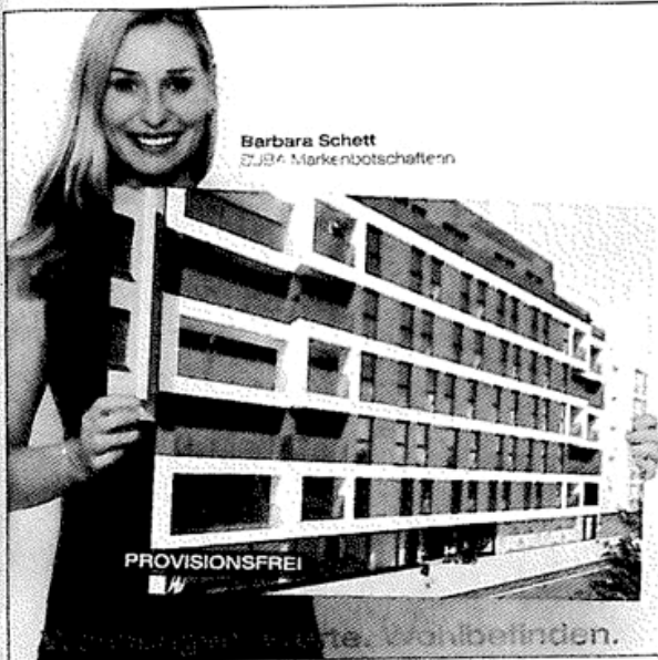
Barbara Schett SÜBA Markenbotschafterin